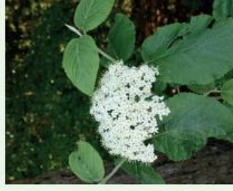
Wolliger Schneeball Viburnum lantana

Die Gemeinde Steinen informiert im Jahr 2022 monatlich über einen invasiven Neophyten.