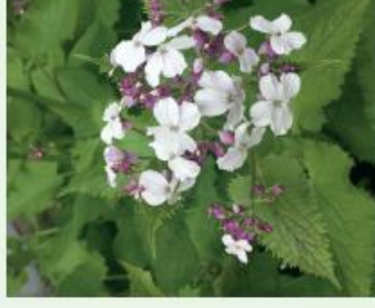
Wilde Mondviole Lunaria rediviva