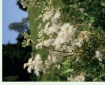
Mädesüss Filipendula ulmaria