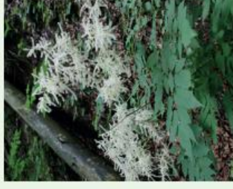
Wald-Geissbart Aruncus dioicus