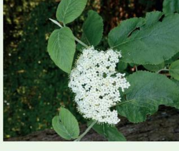
Wolliger Schneeball Viburnum lantana

Die Gemeinde Steinen informiert im Jahr 2021 monatlich über einen invasiven Neophyten. Diese Faktenblätter finden Sie unter: www.steinen.ch