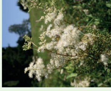
Mädesüß Filipendula ulmaria