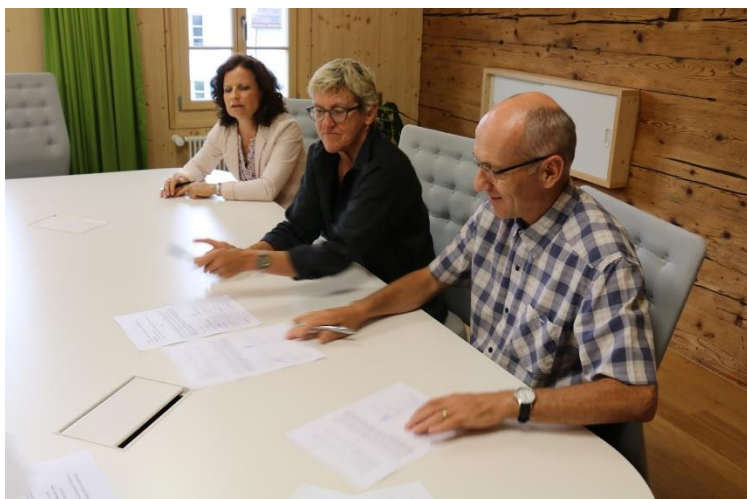
Auch die Verwaltungsratsmitglieder mussten unterschreiben.