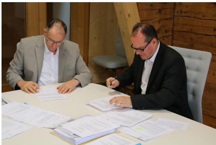
Der Gemeindepräsident und der Gemeindeschreiber beim Unterzeichnen der Gründungsunterlagen.