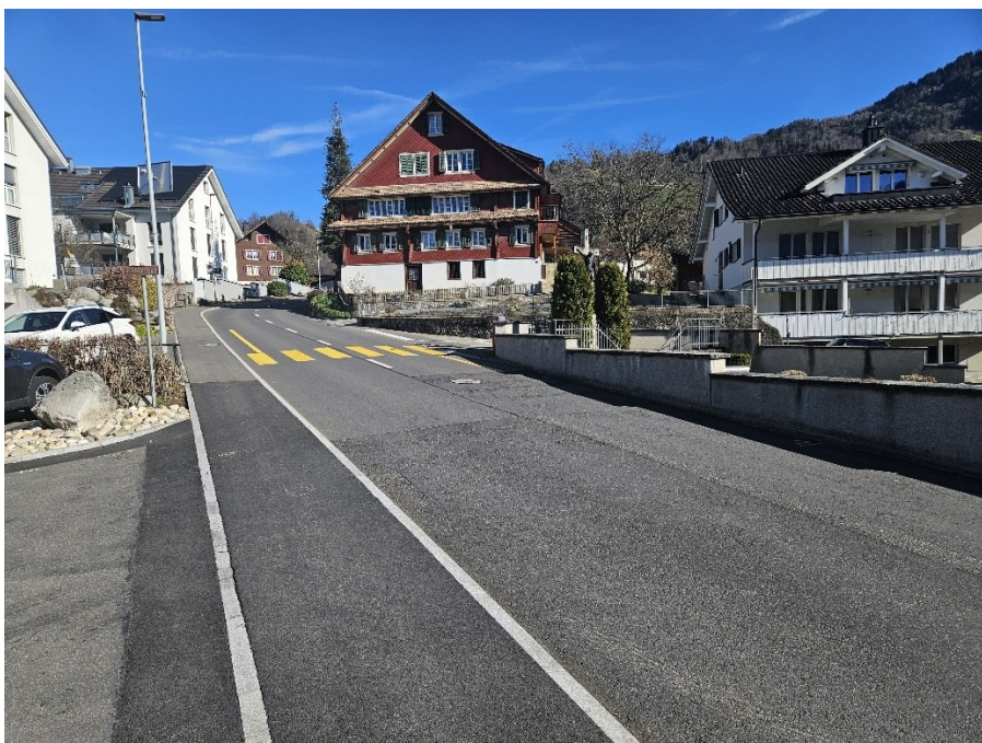
Im Bereich Höhe Friedhof ergaben die Geschwindigkeitsmessungen deutliche Überschreitungen.